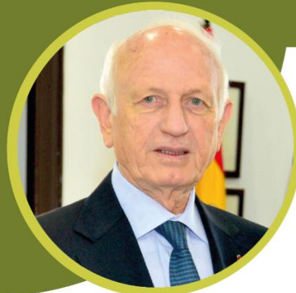
S.E. M. André AZOULAY

Pour avoir présidé le Comité Exécutif de la Fondation pour les trois cultures et les trois religions. Œuvré également comme membre fondateur du Forum C -10 de Davos relatif au dialogue des civilisations et des religions. Aussi en tant que membre du Comité des Sages pour l'Alliance des civilisations à l'ONU et fervent militant pour la noble cause du vivre ensemble et la paix entre les peuples.